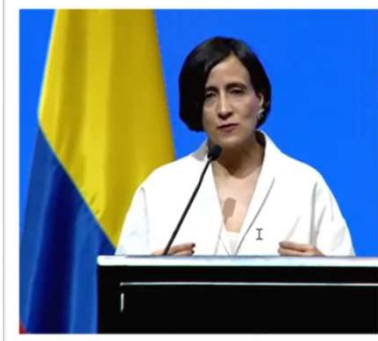
スサナ・ムハマド コロンビア環境・持続可能 開発大臣（COP16議長）