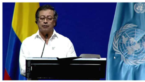
グスタボ・ペドロ コロンビア共和国大統領